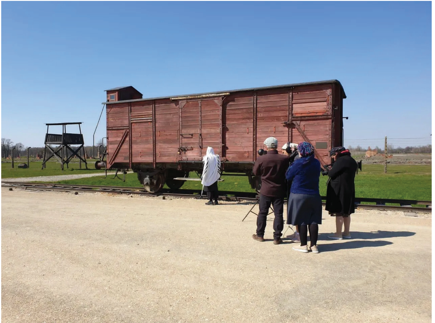
יצירות הסרט מצלמות את הסיור הווירטואלי באושוויץ. צילמו "מזריחה לשקיעה"

למבקרים. ה'קלאנג' הזה של המפתח ננעל מאחורינו, והרחפן באוויר משדר צילומים, ואז אנחנו רק מתחילות להבין את הגודל של המקום. עמדנו שם משותקות ואנחנו לא מסוגלות לעשות כלום". במשך שלושה ימים צילמו במחנה "מזריחה לשקיעה". בלילה ישנו בעיירה אושווינצ'ים.